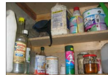
6. attēls. Ķīmisko vielu glabāšana neatbilstošos un nemarkētos traukos – nelaimes gadījumi var notikt, netišām tās iedzerot vai nepareizi lietojot.