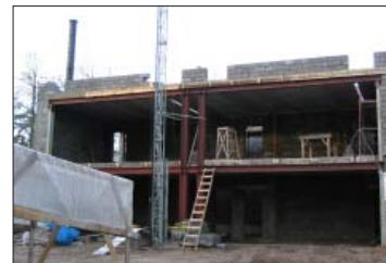
3. attēls. Drošai kāpšanai nepiemērotas kāpnes un nenožogotas atvērums malas – nelaimes gadījumi var notikt, kāpjot augšā vai lejā, jo kāpnes nav pietiekama garuma.

Šī materiāla uzdevums ir iepazīstināt ar jauno nelaimes gadījumu izmeklēšanas un uzskaites kārtību.