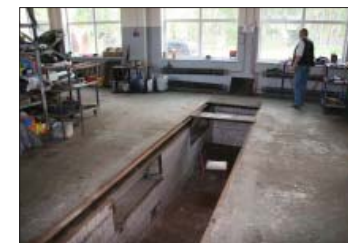
4. attēls. Nenosegta remonta bedre autoservisā – nelaimes gadījumi var notikt, netišām iekrītot bedrē vai kāpjot tai pāri.