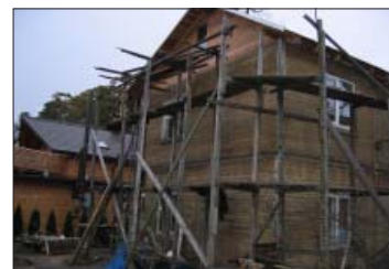
5. attēls. Prasībām neatbilstošas sastatnes – nelaimes gadījumi var notikt, krītot no sastatnēm vai tām sabrūkot.