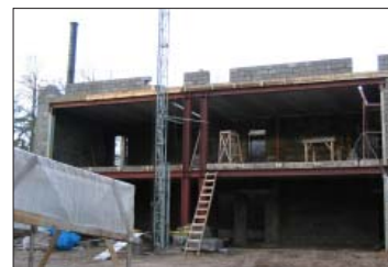
3. attēls. Drošai kāpšanai nepiemērotas kāpnes un nenožogotas atvērums malas – nelaimes gadījumi var notikt, kāpjot augšā vai lejā, jo kāpnes nav pietiekama garuma.

Šī materiāla uzdevums ir iepazīstināt ar jauno nelaimes gadījumu izmeklēšanas un uzskaites kārtību.