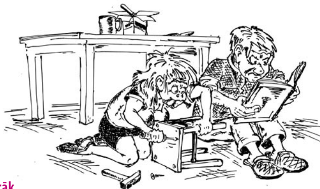
Sievietes labprāt dara visus mājas darbus

Vairāk nekā puse iedzīvotāju uzskata, ka Latvijas vīrieši ir gatavi aktīvāk iesaistīties bērnu audzināšanā. Tam nepiekrīt 32% aptaujāto, bet 4% uzskata, ka bērnu audzināšana vispār nav vīriešu pienākums. Pozitīvāk vīriešu gatavību uzņemties lielāku līdzdalību bērna audzināšanā vērtē iedzīvotāji vecumā no 25 līdz 34 gadiem, ar augstāko izglītību un lieliem ienākumiem. Arī paši vīrieši savu gatavību iesaistīties bērnu audzināšanā vērtē optimistiskāk nekā sievietes – 65% uzskata, ka ir gatavi to darīt aktīvāk. Tikai 18% domā, ka nav gatavi, un 7% – ka tas nav vīriešu pienākums. Turpretim sievietes ir skeptiskākas – nedaudz vairāk nekā 40% uzskata, ka Latvijas vīrieši ir gatavi iesaistīties bērnu audzināšanā, un tikpat daudz domā, ka tomēr nav.