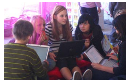
Datordienasgrāmatās tiek apspriesti pārdarītāji