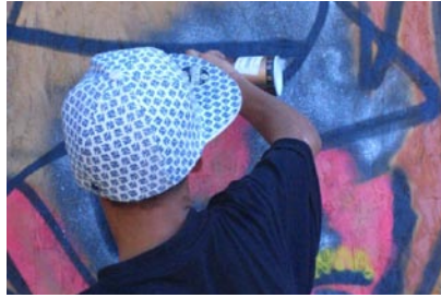
Kopīga zīmēšana pret pārdarīšanu

Gandrīz ceturto daļu Latvijas iedzīvotāju skolas laikā aizskāruši vienaudži. Visbiežāk bērni tiek aizskarti emocionāli. Sociālais statuss, ārējais izskats un rakstura īpašības – tie ir galvenie iemesli, kāpēc jaunieši cits citam dara pāri.