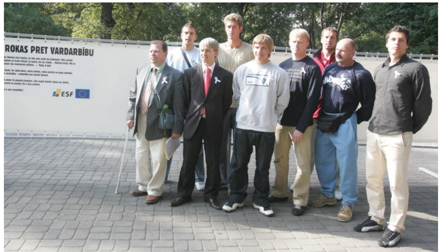
Akcijas atklāšanā piedalījās 11 dažādu sporta veidu pārstāvji