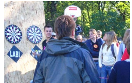
Slikti vai labi – tāds ir jautājums

mērķī. Desmit jaunieši, kuri pareizi atbildēja uz anketas jautājumiem par pārdarīšanu, ieguva unikālu iespēju piedalīties labāko Latvijas skeitbordistu meistarklasēs. Izdomājot oriģinālu aicinājumu, kas mudina nedarīt citiem pāri, skolēni cīnījās par jaunu skeitborda dēli. Pasākumā bija arī kopīga tematiskā zīmējuma veidošana un repa dziesmas dziedāšana.