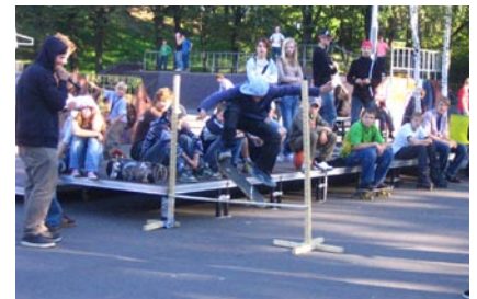
Augstākie lēcēji tika pie cepures ar uzrakstu «Nedari otram pāri»