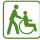
Piemērots cilvēkiem ratiņkrēslā ar pavadoni