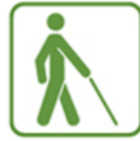
Piemērots cilvēkiem ar redzes traucējumiem