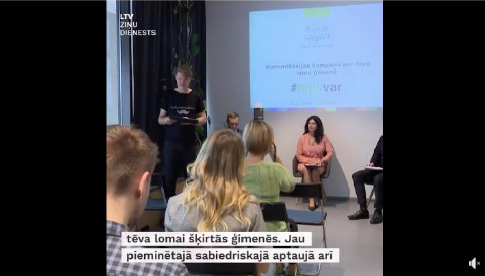
tēva lomai šķirtās ģimenēs. Jau pieminētajā sabiedriskajā aptaujā arī

Latvijā rūpes par bērniem aizvien lielā mērā tiek uzskatītas par sievietes atbildību.... See more