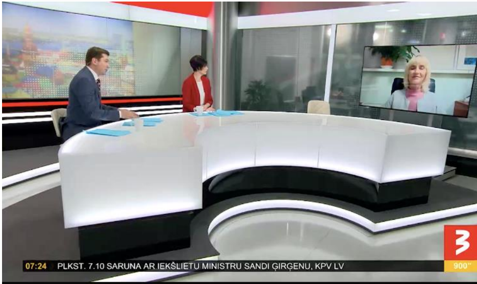
900 sekundes Kampaņā #tētisvar uzsvēr tēva lomu ģimenē