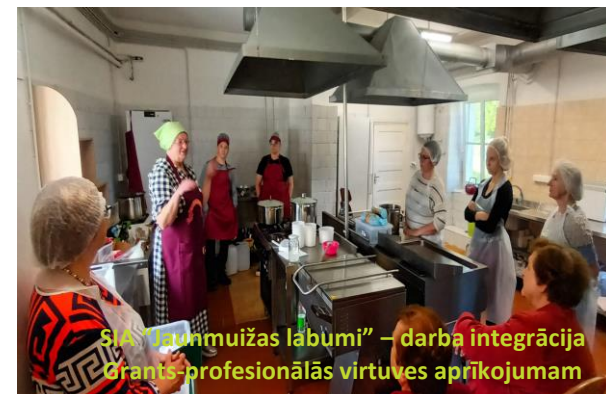
SIA "Lunmuižas labumi" – darba integrācija Grants-profesionālās virtuves aprīkojumam