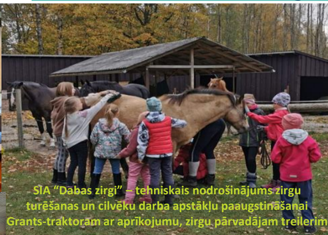
SIA "Dabas zirgi" – tehniskais nodrošinājums zirgu turēšanas un cilvēku darba apstākļu paaugstināšanai Grants-traktoram ar aprīkojumu, zirgu pārvadājam trailerim