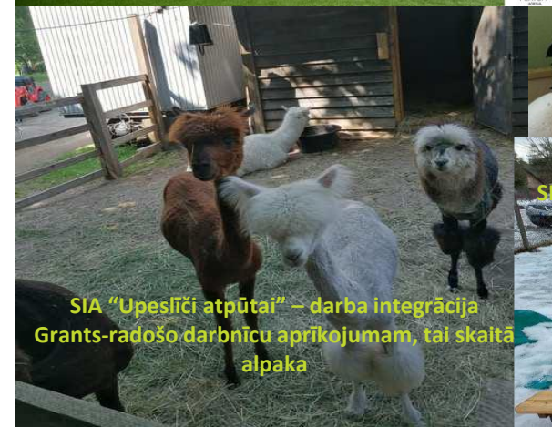
SIA "Upeslīči atpūtai" – darba integrācija Grants-radošo darbnīcu aprīkojumam, tai skaitā alpaka