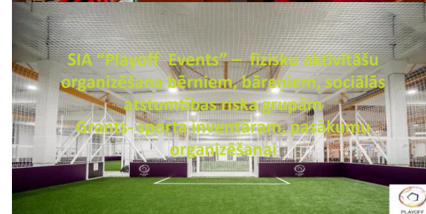
SIA "Playoff Events" – fizisku aktivitāšu organizēšana bērniem, bērniem, sociālās atstumības riska grupām Grants- sporta inventāram, pasākumu organizēšanai