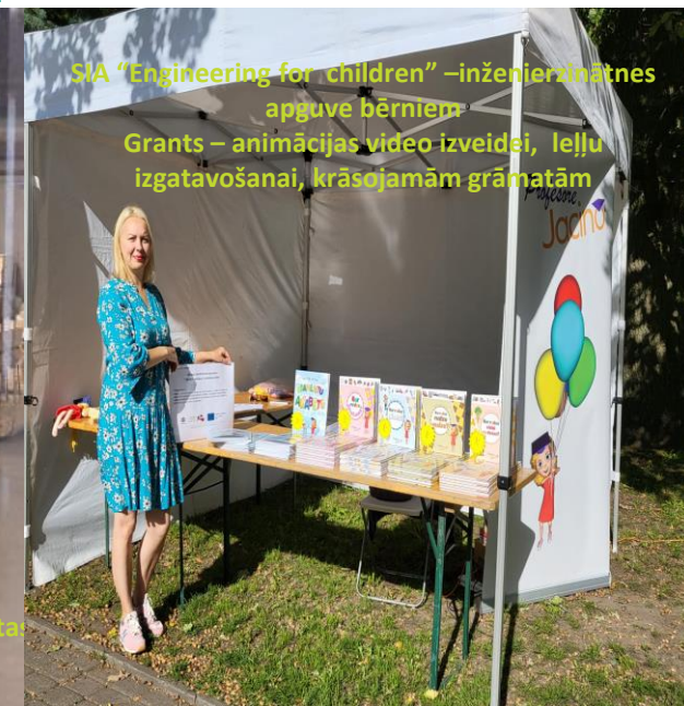
SIA "Engineering for children" – inženierzinātnes apgūve bērniem Grants – animācijas video izveidei, leļļu izgatavošanai, krāsojamām grāmatām