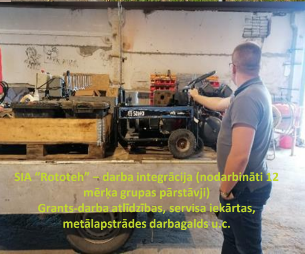
SIA "Rototeh" – darba integrācija (nodarbināti 12 mērķa grupas pārstāvji) Grants-darba atlīdzības, servisa iekārtas, metālapstrādes darbagalds u.c.