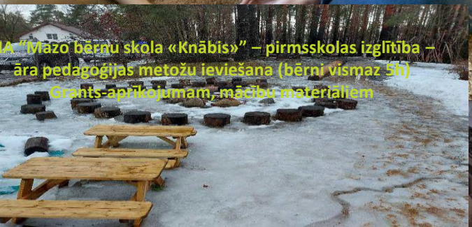
SIA "Mazo bērnu skola «Knābis»" – pirmsskolas izglītība – āra pedagogijas metožu ieviešana (bērni vismaz 5h) Grants-aprīkojumam, mācību materiāliem