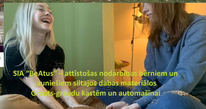
SIA "BeAtus" – attīstošas nodarbības bērniem un jauniešiem siltajos dabas materiālos Grants-graudu kastēm un automašīnai