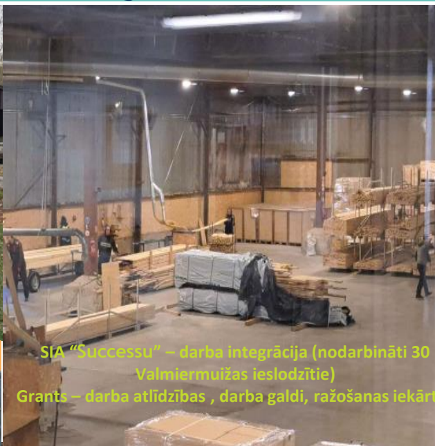
SIA "Successu" – darba integrācija (nodarbināti 30 Valmiermuižas ieslodzītie) Grants – darba atlīdzības, darba galdi, ražošanas iekārta