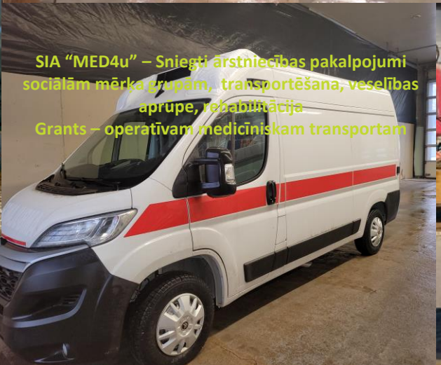
SIA "MED4u" – Sniegti ārstniecības pakalpojumi sociālām mērķa grupām, transportēšana, veselības aprūpe, rehabilitācija Grants – operatīvam medicīniskam transportam